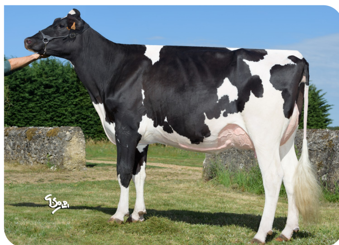
Suzy (v. Adlon P)