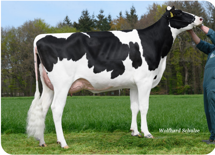
Suleika (v. Adlon P)