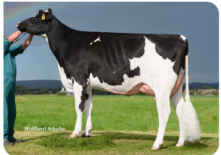
Adia (v. Adlon P)