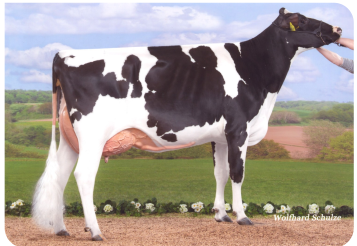
Rica (v. Adlon P)