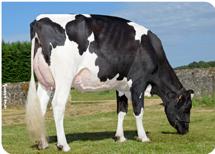
Suzy (v. Adlon P)