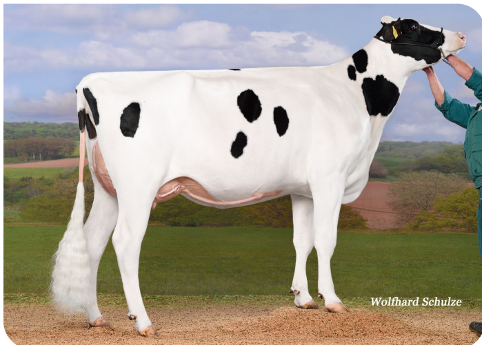
Clara MUH (v. Adlon P)