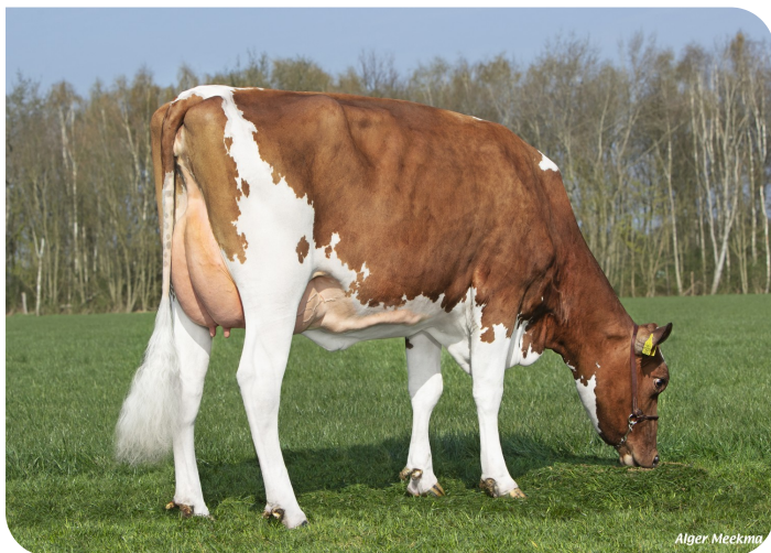
Grashoek Ruth 235 (v. Movistar) Eig.: Fok- en melkveebedrijf K.I. Samen B.V., Grashoek