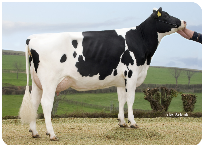
Apina Massia 172 (AB 87) (grootmoeder van Movistar)