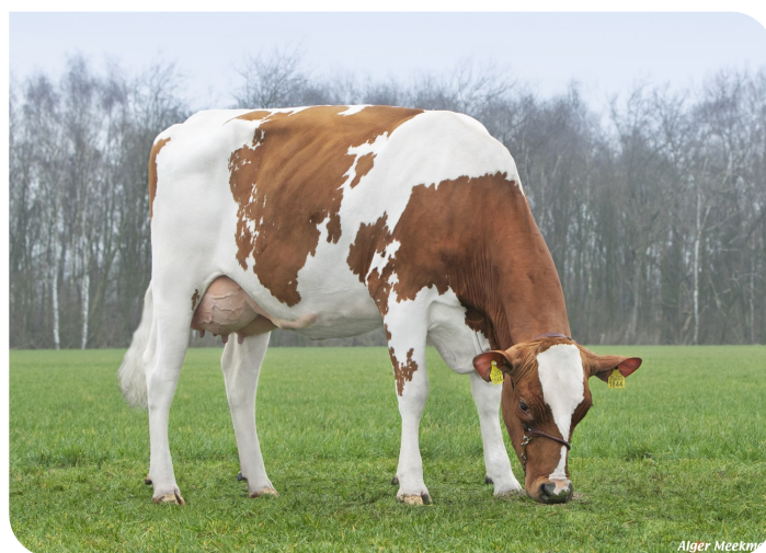
Grashoek Hanna 1844 (v. Movistar) Fig.: Fok- en melkveebedrijf K.I. Samen B.V., Grashoek