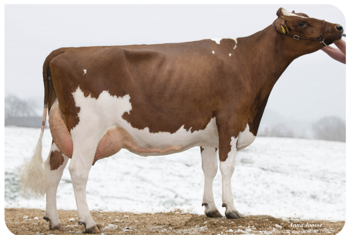
Massia 270 (AB 89) (volle zus van Movistar)