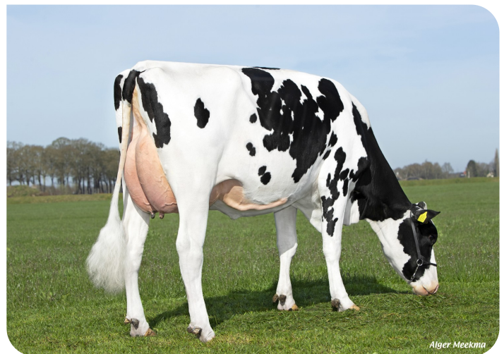
Apina Nadja 167 (v. Movistar) Eig.: Melkveebedrijf Coppelmans VOF, Beerzerveld