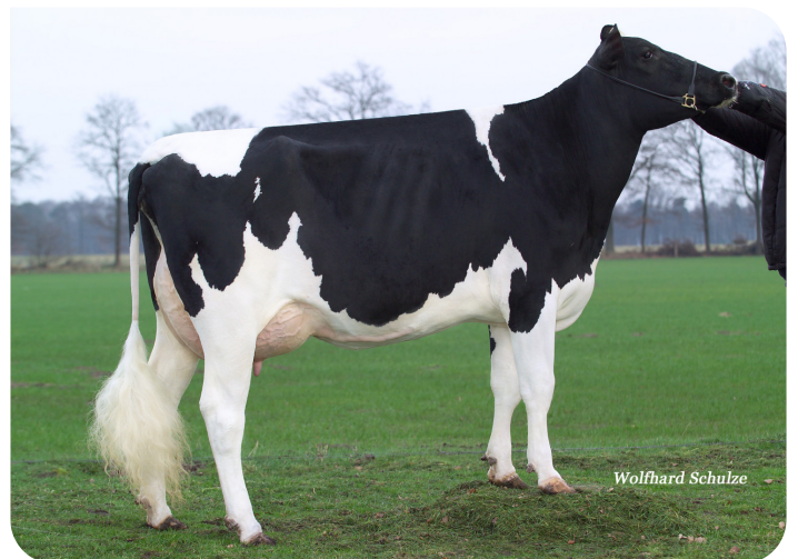
Hf Qualsiasi (AB 87) (grootmoeder van Suanley)