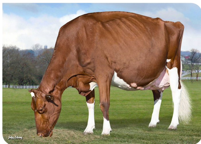
KHW-Regiment Apple-Red (EX 96) (moeder van Challenger-Red)