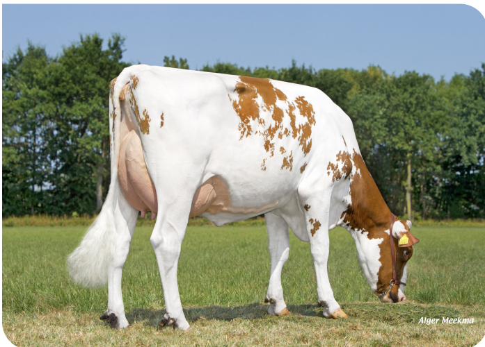
Grashoek Silke 212 (v. Archimedes rf) Eig.: Melkveebedrijf Grashoek b.v., Grashoek