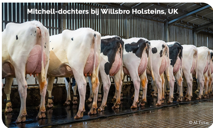
dochtergroep Mitchell, Willsbro Holsteins, Wadebridge, UK