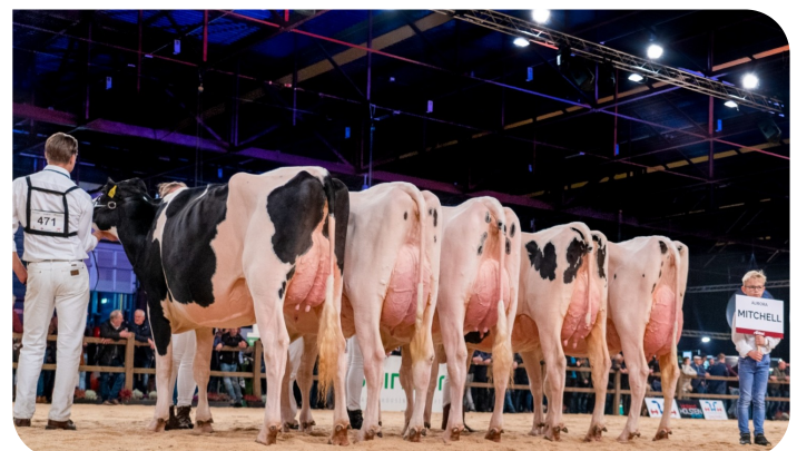
Dochtergroep Mitchell HHH-show 2022