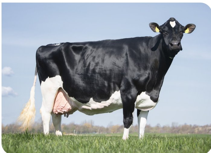
Hanna 912 (EX93) (moeder van Ragnar)