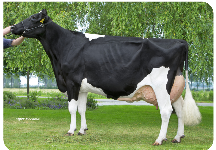
Beeze Roza 48 (A 90) (moeder van Maikman)