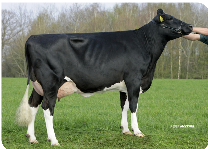
Brechtje 1 (v. Blackjack) Eig.: Mts. de Groot, De Rips