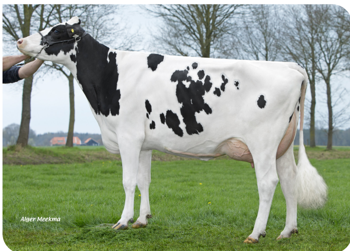
Sonja 99 (v. Clyde)