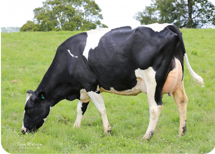
Akkersma Clyde Star (v. Clyde) Eig.: Akkersma (NZ)