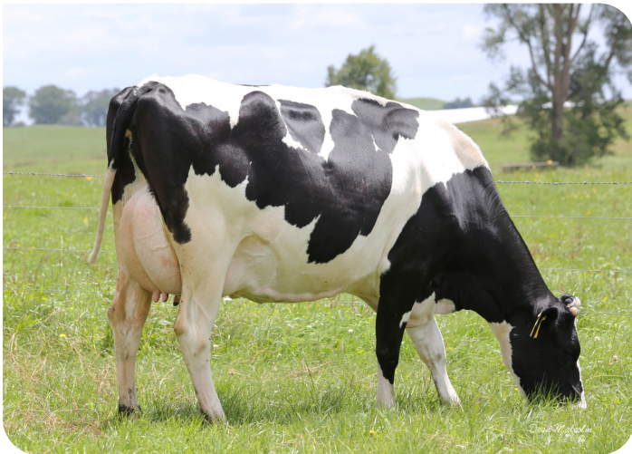
Akkersma Clyde Vicky (v. Clyde) Eig.: Akkersma (NZ)