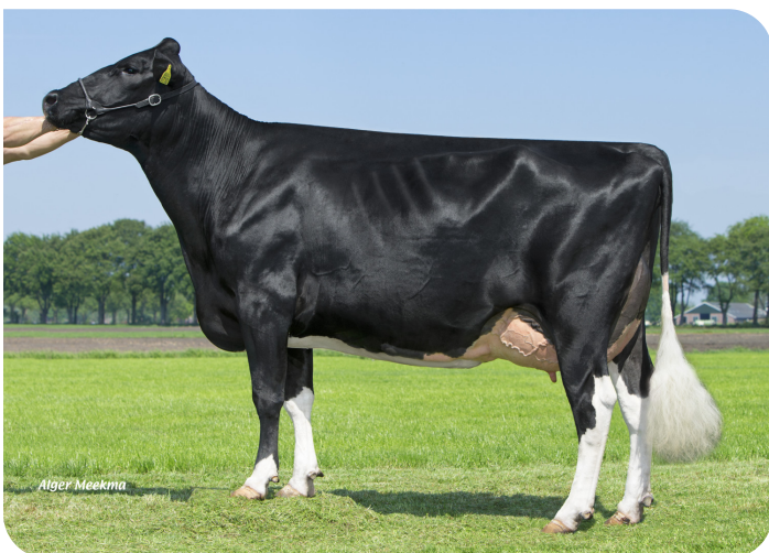
Big Anna Jacoba 126 (AB 87) (v. Shogun PS) (halfzus van Clyde)