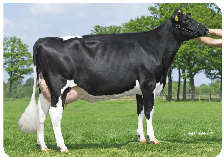
Ynskje 168 (v. Clyde)