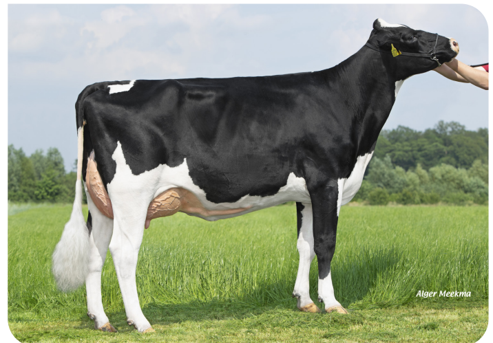
Herma 30 (v. Evergreen) Eig.: Melkveebedrijf Bots, Rekken