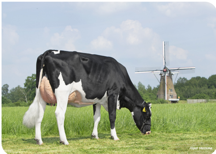
Herma 30 (v. Evergreen) Eig.: Melkveebedrijf Bots, Rekken