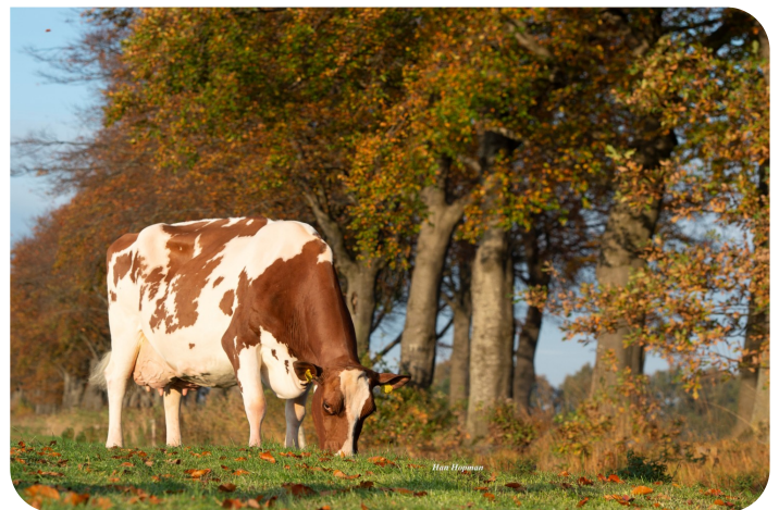
Big Super Star 69 (EX 91) (grootmoeder van Radar Love)