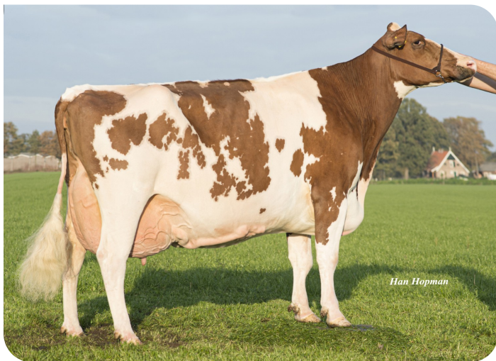
Big Super Star 69 (EX 91) (grootmoeder van Radar Love)