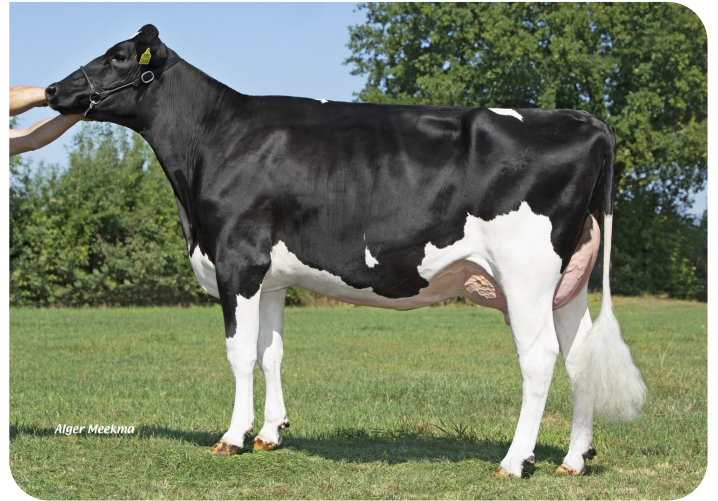
Talke 93 (v. Redstar) Eig.: Mts. A.J.M.Lenferink, Almelo