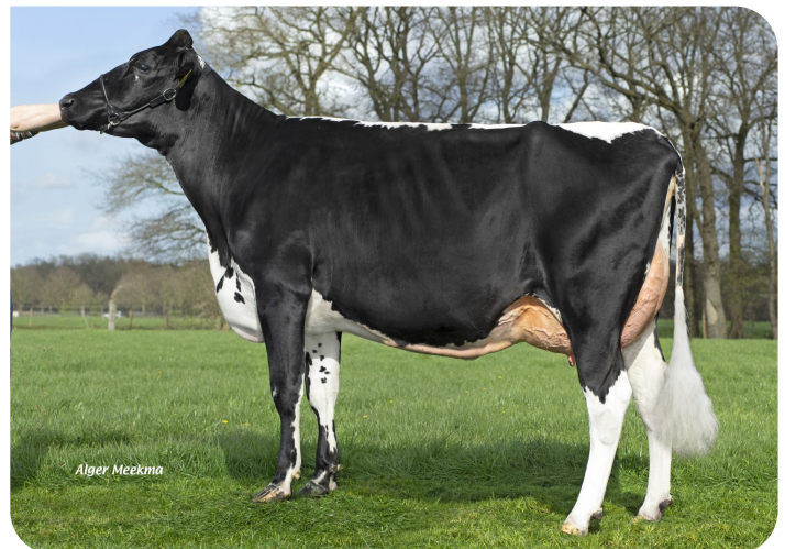
Angels Holdi 563 (v. Redstar) Eig.: Angels Holsteins, Meijel