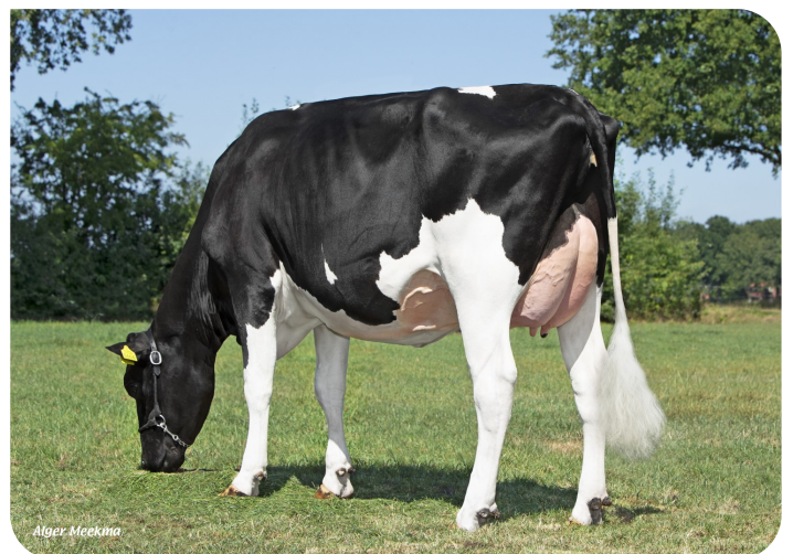
Talke 93 (v. Redstar) Eig.: Mts. A.J.M. Lenferink, Almelo