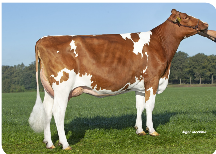
Angels Holdi 563 (v. Redstar) Eig.: Angels Holsteins, Meijel