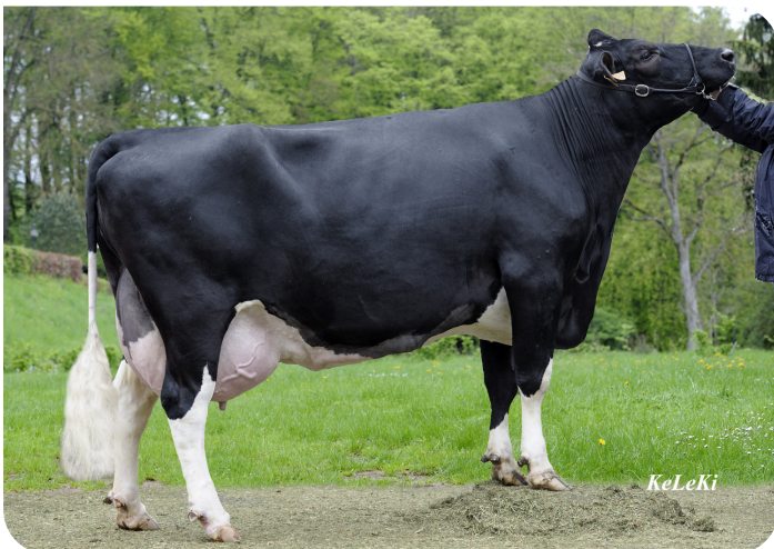
Valor Kiralle 853 (A 90) (grootmoeder van Bisor)