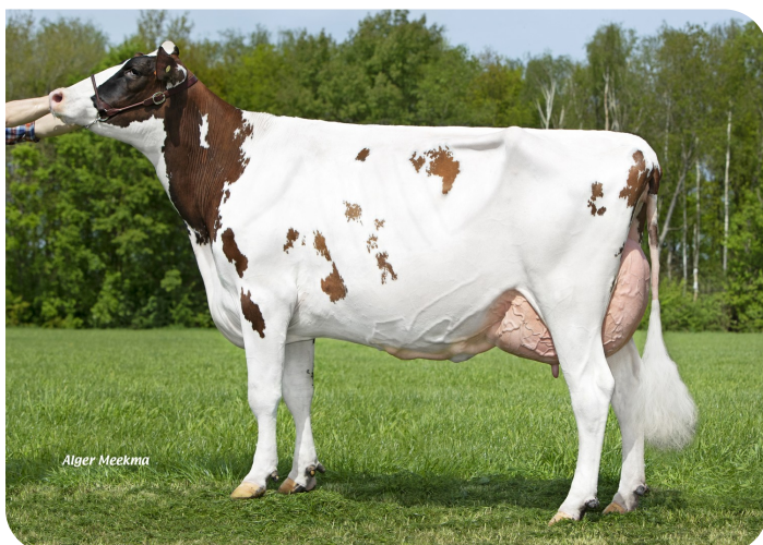
Grashoek Anna-Jacoba 13 (v. Dex)

Eig.: Fok- en melkveebedrijf K.I. SAMEN B.V., Grashoek