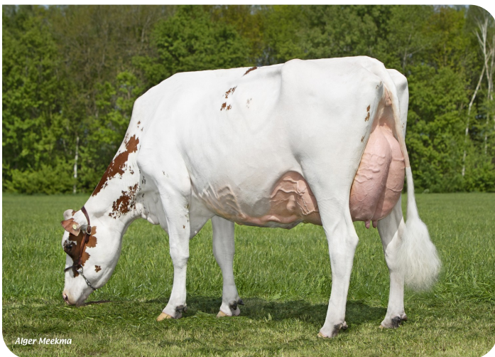
Grashoek Thrincia 4 (v. Dex) Eig.: Fok- en melkveebedrijf K.I. SAMEN B.V., Grashoek