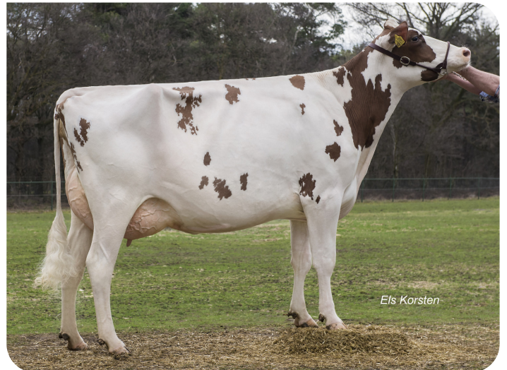
Massia 9857 van de Peul (EX91) Moeder van Dex