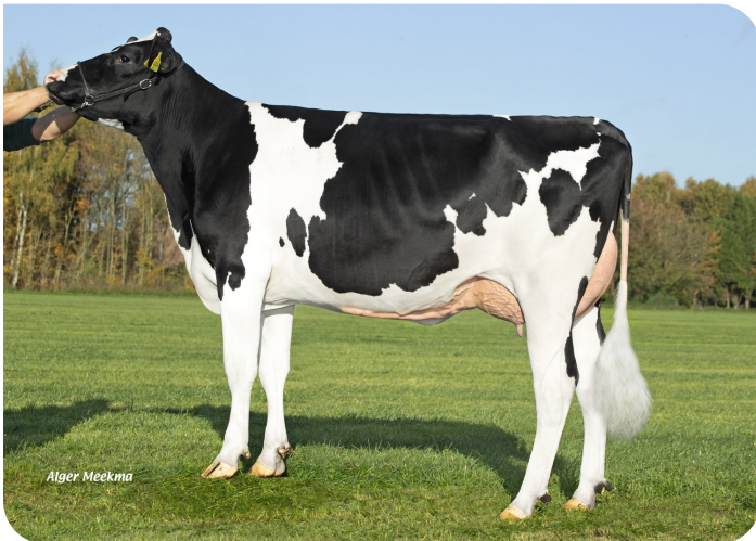
Grashoek Nordika 23 (AB 87) (v. Dex) Eig.: Fok- en melkveebedrijf K.I. SAMEN B.V., Grashoek