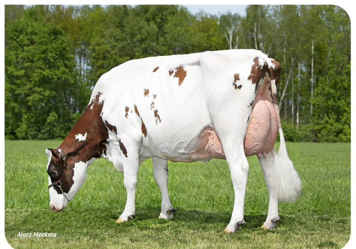
Grashoek Anna-Jacoba 13 (v. Dex) Eig.: Fok- en melkveebedrijf K.I. SAMEN B.V., Grashoek