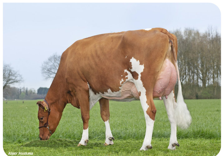
Grashoek Nordika 25 (v. Dex)

Eig.: Fok- en melkveebedrijf K.I. SAMEN B.V., Grashoek