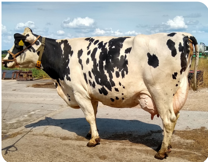
Bonhill Warsi 280 (AB 85) Moeder van Rambam RF