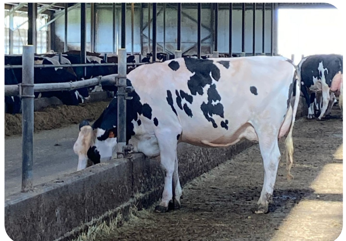
Grashoek Silvia 110 (v. Rambam RF) Fig.: Fok- en melkveebedrijf K.I. Samen B.V., Grashoek