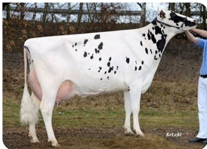
RZB Orleander 1022 (A 91) (grootmoeder van Orlando)