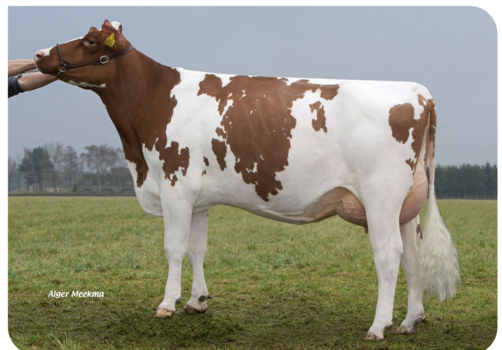
Grashoek Liza 410 (v. Cracker W rf) Fig.: Melkveebedrijf Grashoek b.v., Grashoek