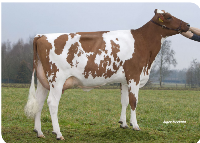
Grashoek Liza 413 (v. Cracker W rf) Fig.: Melkveebedrijf Grashoek b.v., Grashoek