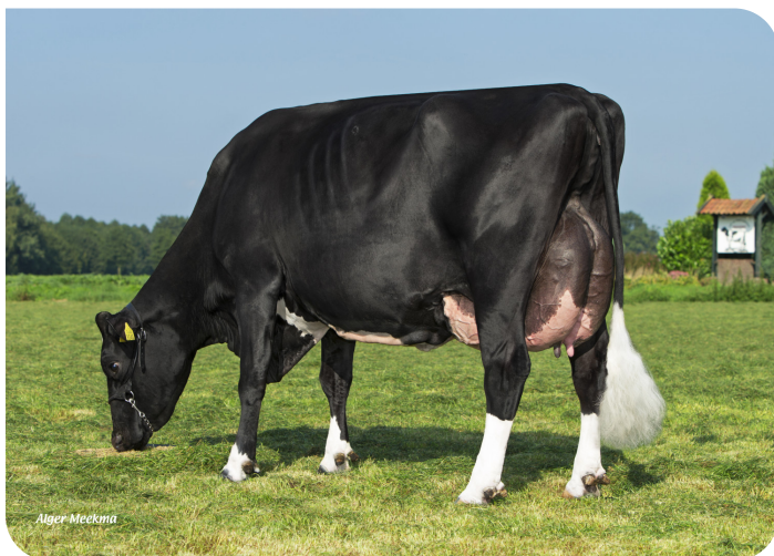
Grashoek Iva 4 (v. Cracker W rf) (foto als 3de kalfs) Eig.: Melkveebedrijf Grashoek b.v., Grashoek