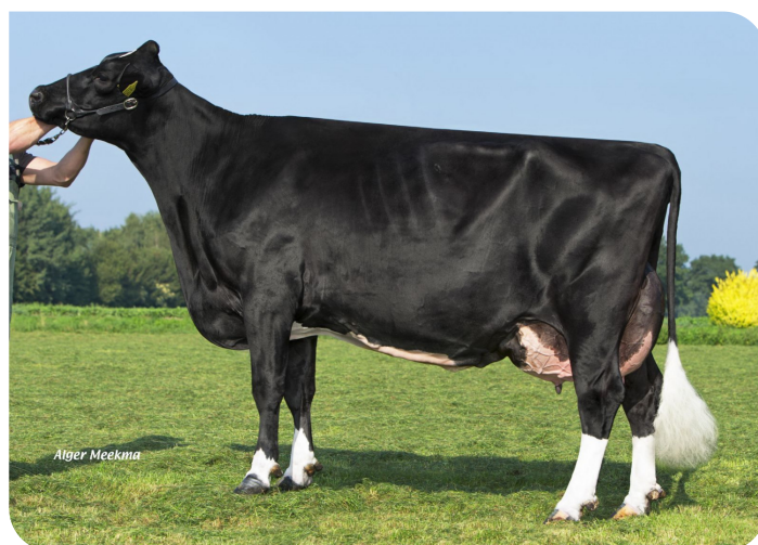
Grashoek Iva 4 (v. Cracker W rf) (foto als 3de kalfs) Eig.: Melkveebedrijf Grashoek b.v., Grashoek