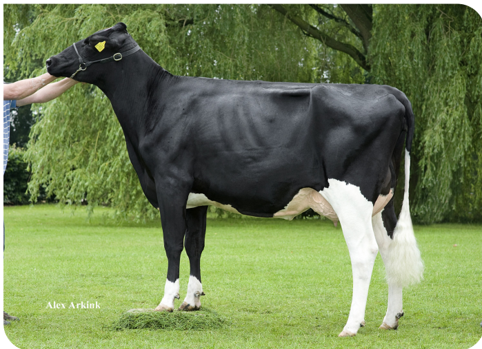
De Biesheuvel Javina 50 (AB 87) (moeder van Creon rf (Pp))