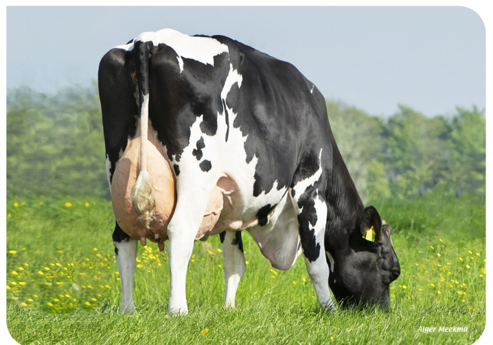
Emma 955 (VG 89) Moeder van Body