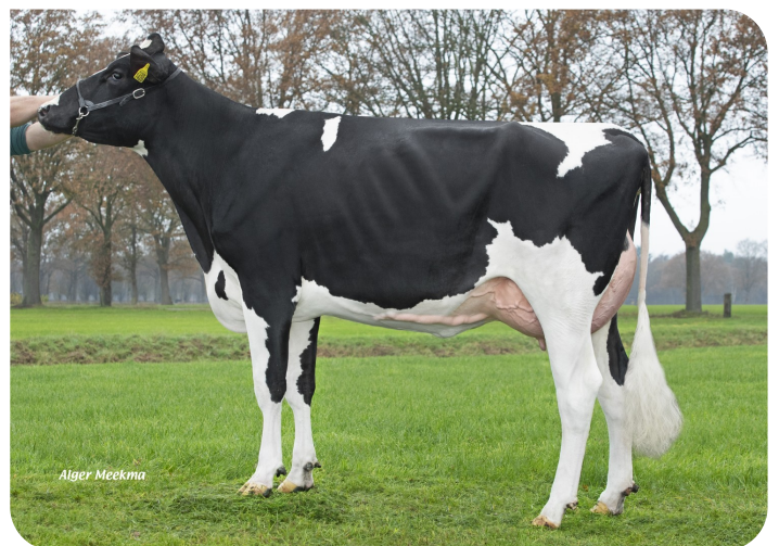
Kooifarm Tonia 29 (v. Davy) Fig.: Klein Baltink C.V., Kring van Dorth