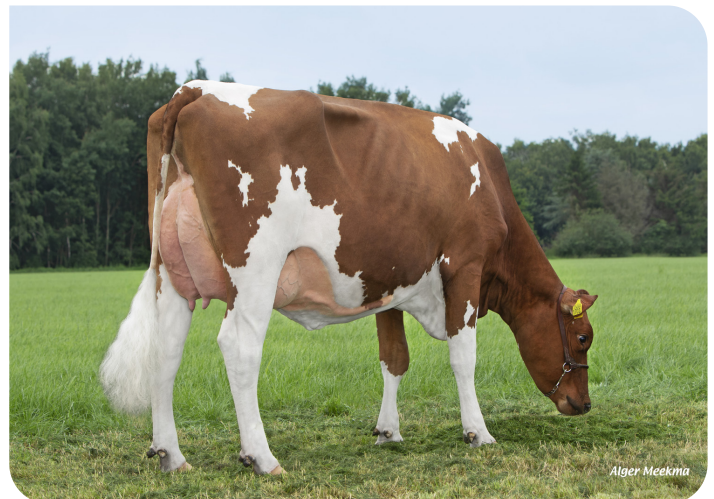
Grashoek Tonnie 100 (v. Powerline) Eig.: Melkveebedrijf Grashoek b.v., Grashoek