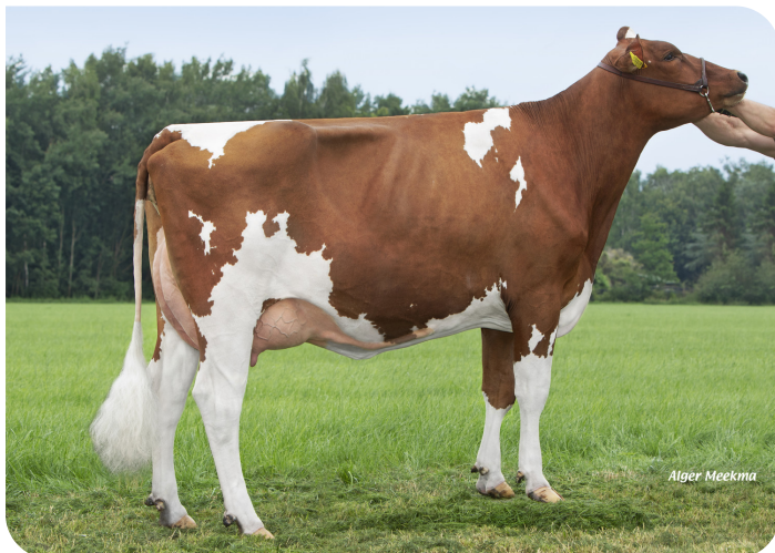
Grashoek Tonnie 100 (v. Powerline) Eig.: Melkveebedrijf Grashoek b.v., Grashoek