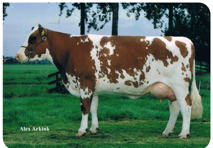
Danielle 51 (A 90) (overgrootmoeder van Duncan)