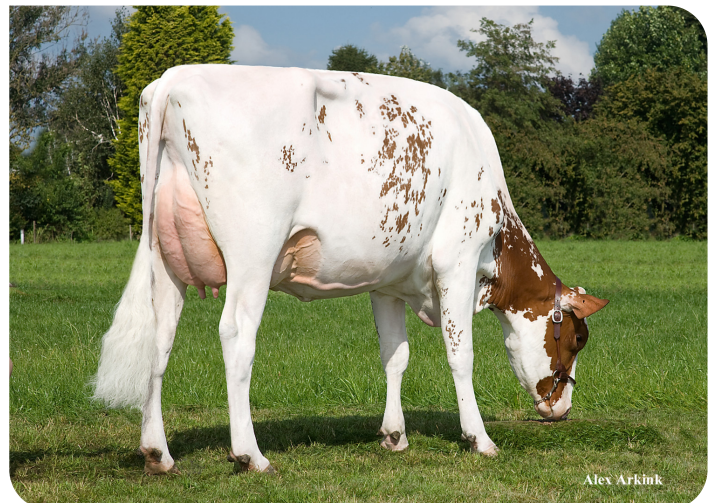
JK Eder All P Red (AB 86) (moeder van All Star rf (PP))