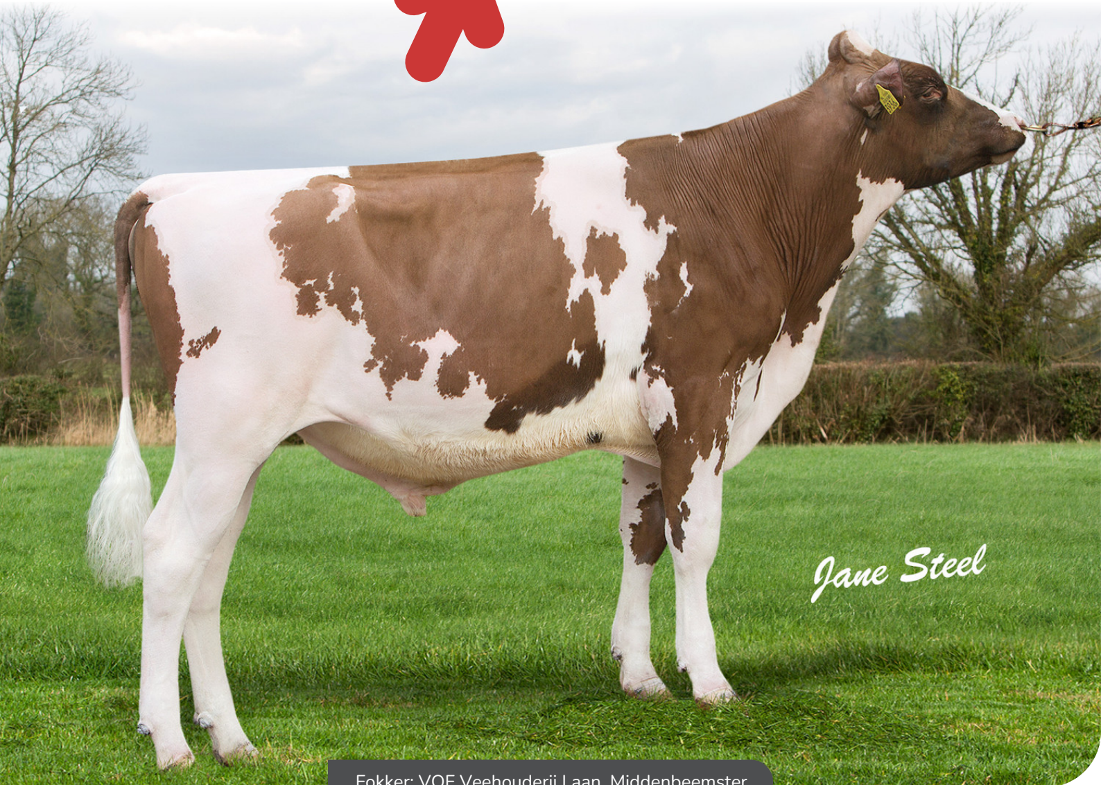
Fokker: VOF Veehouderij Laan, Middenbeemster