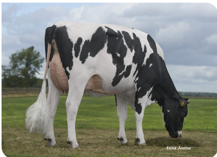
De Volmer DG Caylee (VG 86) (grootmoeder van Casimir)