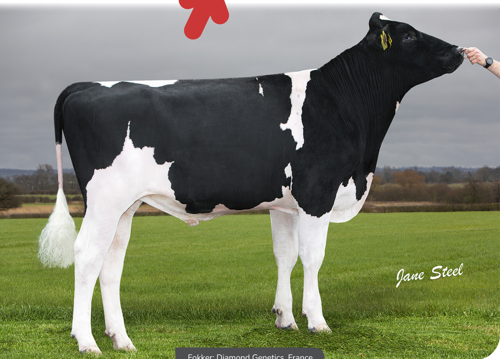
Fokker: Diamond Genetics, France