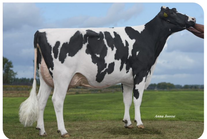
De Volmer DG Caylee (VG 86) (grootmoeder van Casimir)