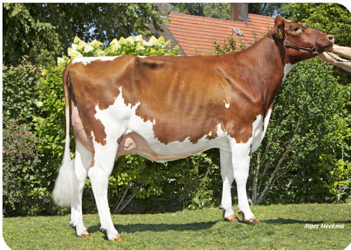
Pieta 168 (v. Abraxas Red P)

Eig.: Melkveebedrijf van Delft VOF, Elshout