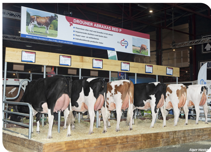
Dochtergroep van Abraxas Red P HHH Leeuwarden 2025