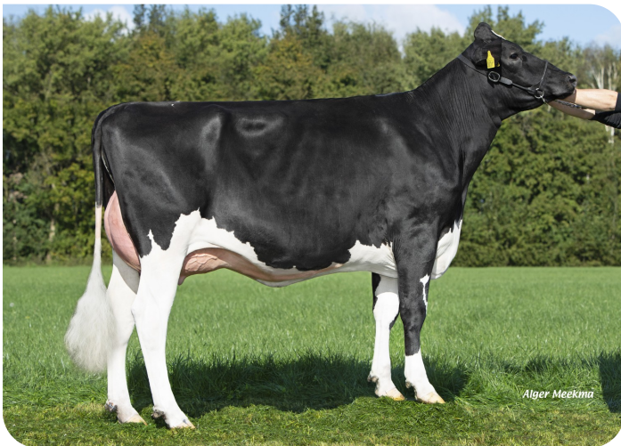
Grashoek Jettie 248 (v. Abraxas Red P) Eig.: Fok- en melkveebedrijf K.I. Samen B.V., Grashoek