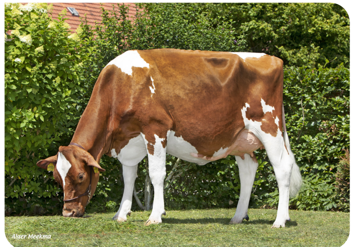
Joke 94 (v. Abraxas Red P)

Eig.: Melkveebedrijf van Delft VOF, Elshout