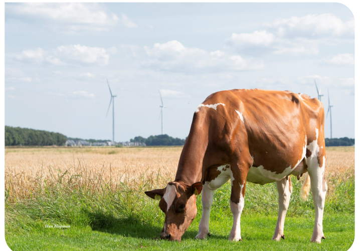
Drouner Aiko 1591 (AB 88) Moeder van Abraxas Red P