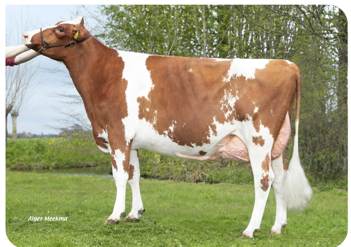
Kooymans Nora 66P (v. Radar Love Red) Fig.: Mts. R. en C. Kooyman-de Jong