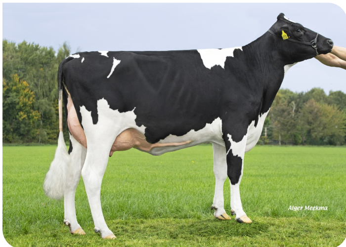
Grashoek Becky 45 (AB 86) (v. Aras) Eig.: Fok- en melkveebedrijf K.I. SAMEN, Grashoek