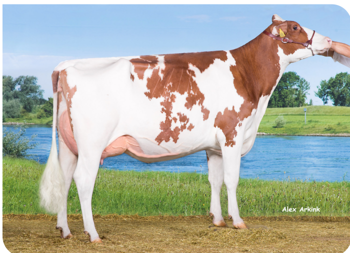
Drouner Ajdh Aiko 1288 (EX 90) (grootmoeder van Aras (Pp))