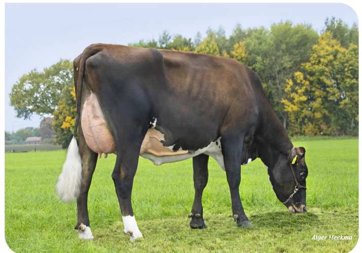
Grashoek Tonnie 108 PP (v. Aras, 75% HF, 25% BS) (AB 85) Eig.: Fok- en melkveebedrijf K.I. SAMEN, Grashoek