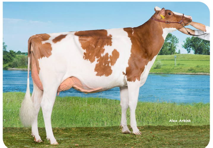
Drouner Aiko 1445 (AB 89) Moeder van Potency Red