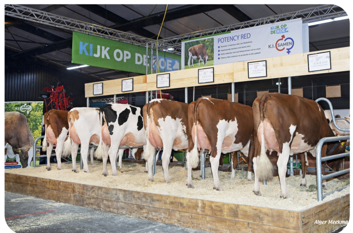
Dochtergroep Drouner Potency, RMV Hardenberg 2025