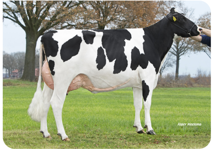
Parade 207 (v. Potency Red) Eig.: Mts. A.J.M. Lenferink, Almelo