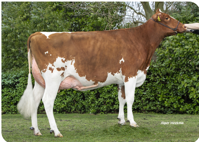
Cuperius 1252 (v. Potency Red) Eig.: VOF Gebr. Posch, Westwoud