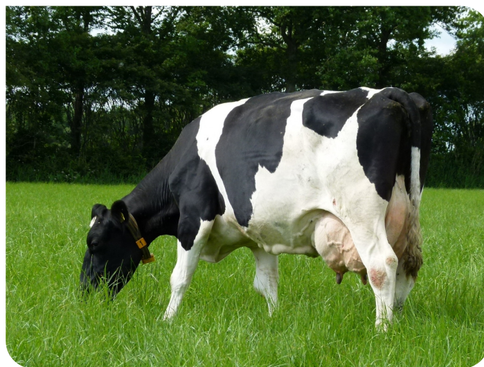
Emma 530 (grootmoeder van Eppie 2)