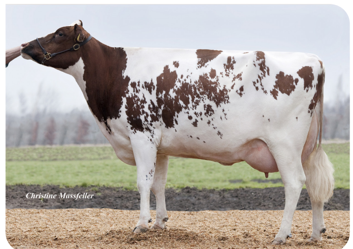
RH Meggy-J (AB 88) (moeder van Gandalf)