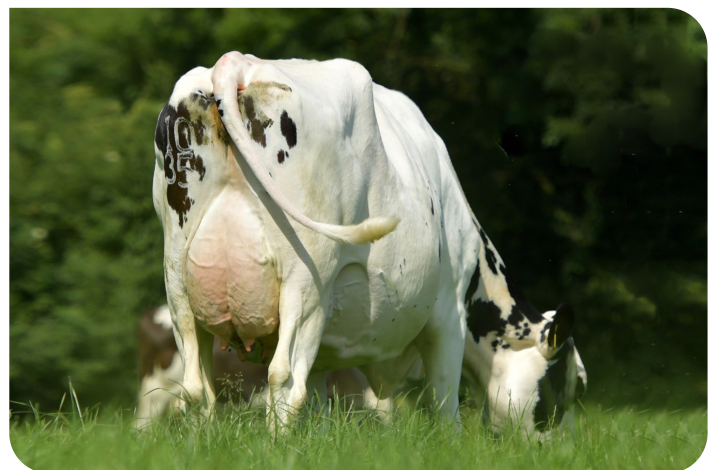
Glenaboy HDJ Daisy (EX90) moeder van Glenaboy Hero