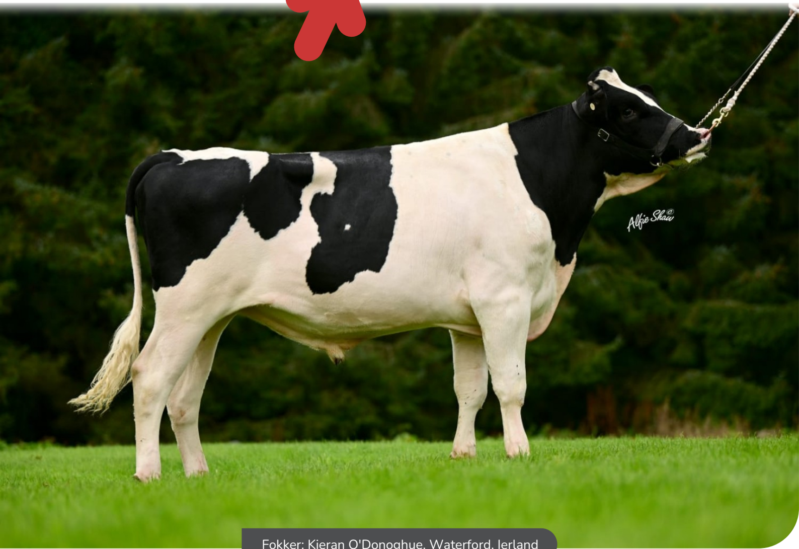
Fokker: Kieran O'Donoghue, Waterford, Ierland