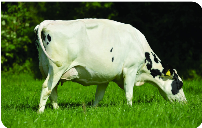
Glenaboy HDJ Daisy (EX90) moeder van Glenaboy Hero