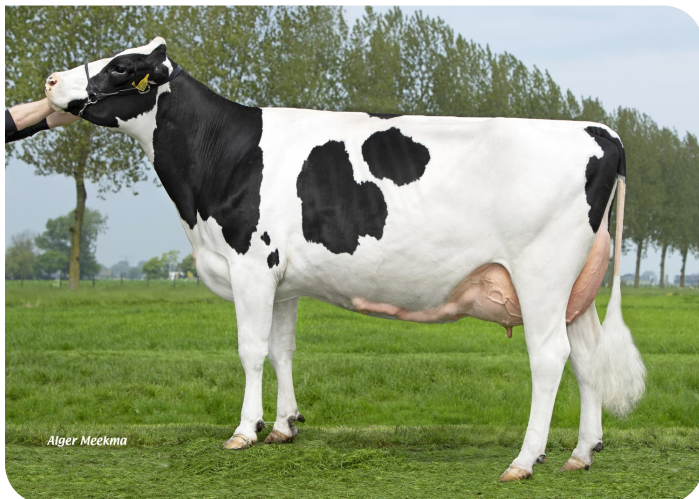
Beatrix 364 (v. Conqueror P)