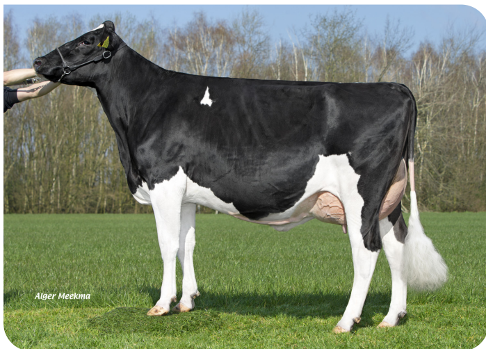
Grashoek Everette 10 (v. Conqueror P) Eig.: Melkveebedrijf Grashoek b.v., Grashoek