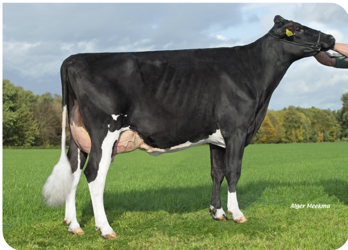
Grashoek Nel 193 (v. Kentucky (Pp)) Eig.: Melkveebedrijf Grashoek, Grashoek