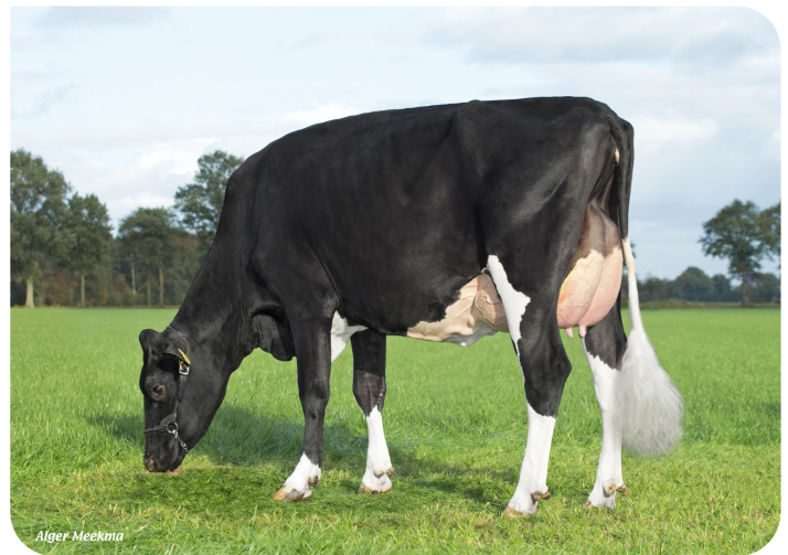
Grashoek Nel 193 (v. Kentucky (Pp)) Eig.: Melkveebedrijf Grashoek, Grashoek