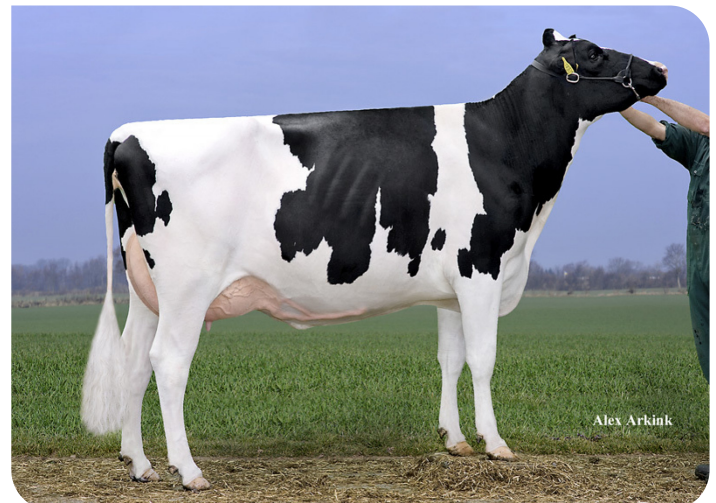
Drouner AJDH Aiko (AB 87) (moeder van Kentucky (Pp))