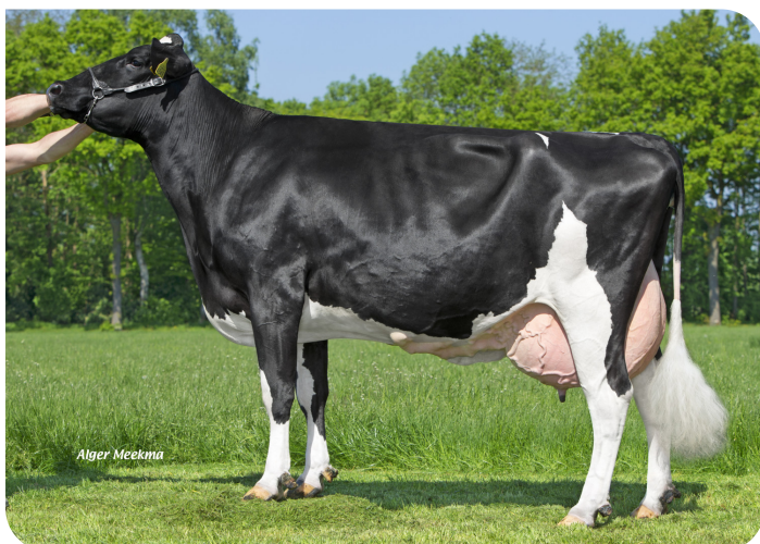
Desibon 32 (AB 87) (moeder van Mareno)