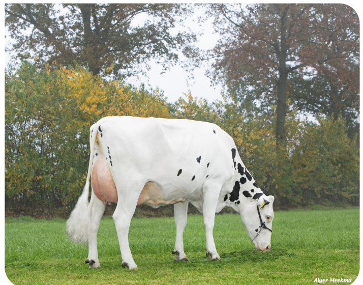
Quarrel 54 (v. Mareno) Fig.: Mts. Steenblik-Tetteroo, Ruurlo