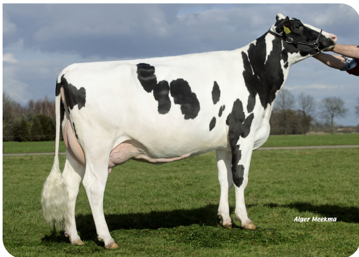
Grashoek Silke 78 (AB 88) (grootmoeder van Talent rf)