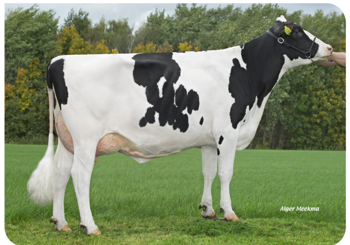
Grashoek Nel 150 (v. Talent rf) Eig.: Fok- en melkveebedrijf K.I. Samen B.V., Grashoek