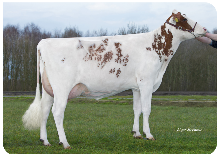
Grashoek Rita 16 (volle zus van Time Zone (Pp)) Eig.: Melkveebedrijf Grashoek b.v., Grashoek