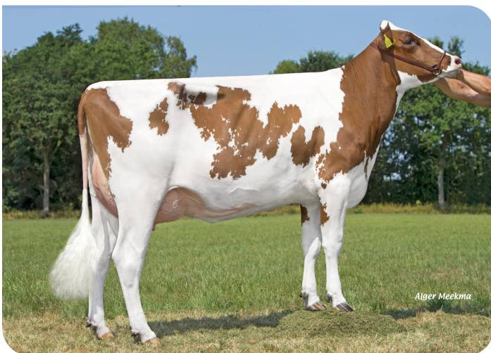
Grashoek Mina 480 (v. Time Zone (Pp)) Eig.: Melkveebedrijf Grashoek b.v., Grashoek