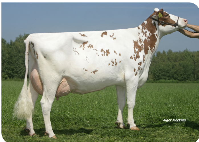
Willem's Hoeve Rita 0249 (AB 87) (grootmoeder van Time Zone (Pp))