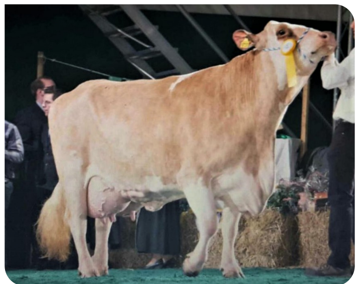
Shirley 1 (3de lactatie) (moeder van Haiko)