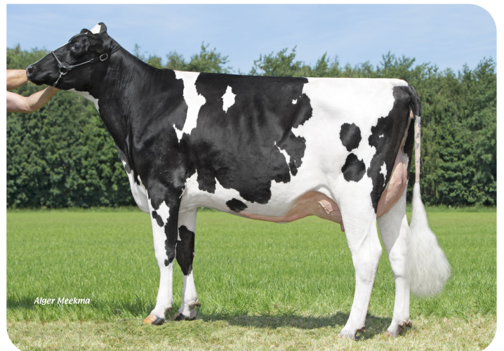
Grashoek Silke 244 (AB 88) (v. Esmar) Fig.: Melkveebedrijf Grashoek b.v., Grashoek