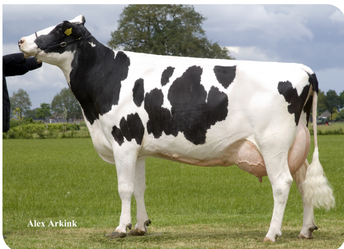
Holbra Petra (A 90) (betovergrootmoeder van Esmar)