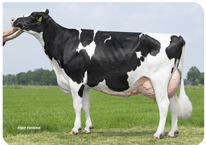
Holbra Malon 3 (AB 88) Moeder van Mastershot