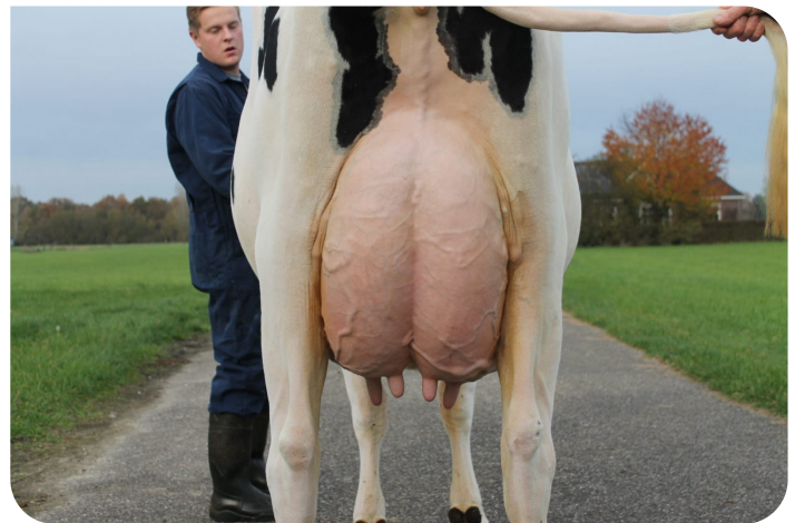
Holbra Malon 8 (Volle zus van Mastershot) Fig.: Holbra Holsteins, Laren (Gld.)