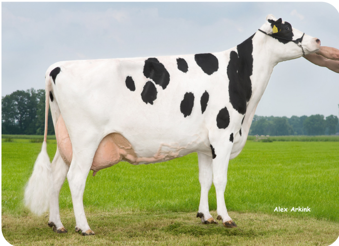
Holbra Malon Grootmoeder van Mastershot