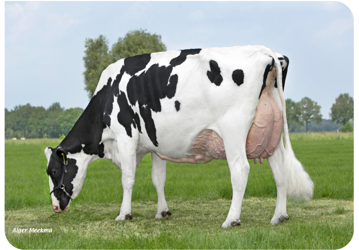
Holbra Malon 8 (Volle zus van Mastershot) Eig.: Holbra Holsteins, Laren (Gld.)