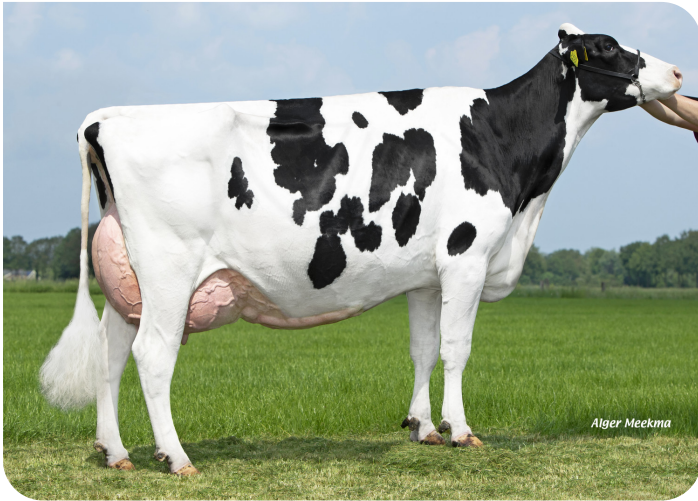
Holbra Malon 8 (Volle zus van Mastershot) Eig.: Holbra Holsteins, Laren (Gld.)