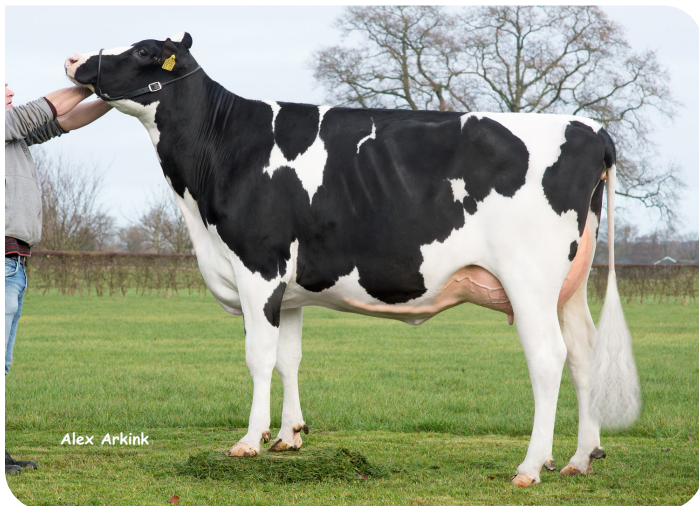
Holbra Malon 3 (AB 88) Moeder van Mastershot