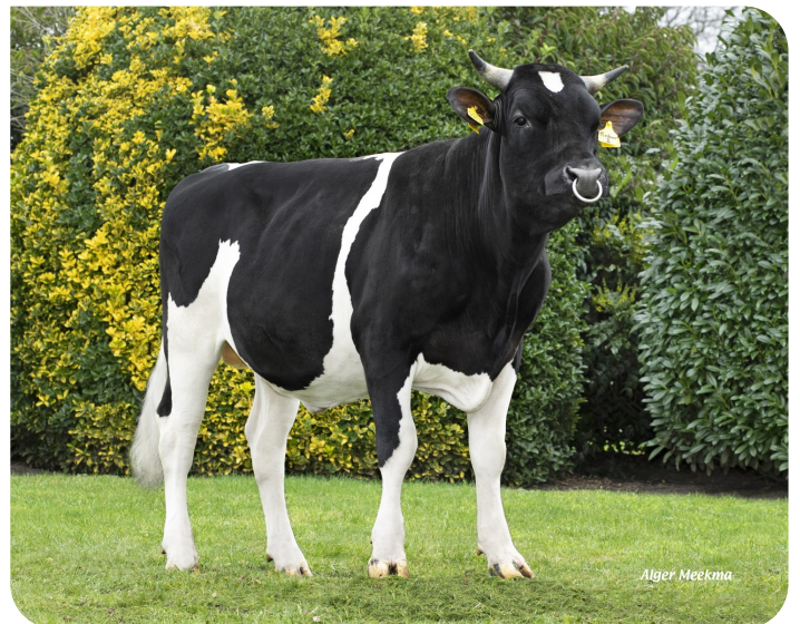
Holwerda Finbar 2