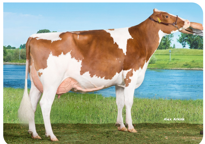
Huntje Holstein Anemoon 183 Moeder van Red Ravello