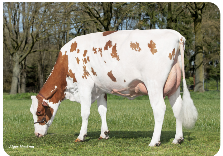
Grietje 314 (v. Red Ravello) Eig.: Rops Dairy, Ysselsteyn