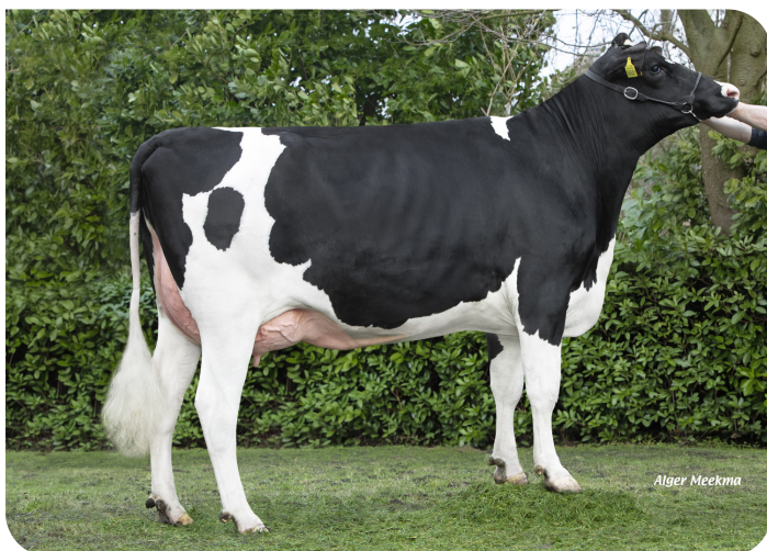
Puk 898 (v. Red Ravello) Eig.: VOF Gebr. Posch, Westwoud