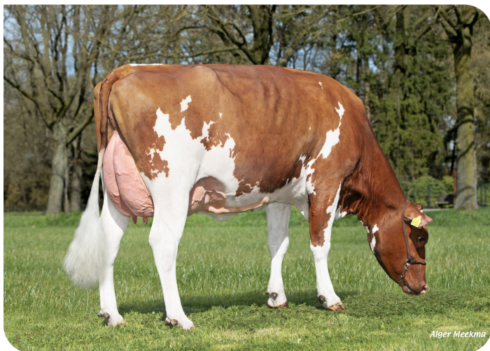
OA Janna 3055 (v. Red Ravello) Eig.: Rops Dairy, Ysselsteyn