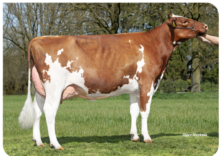
OA Janna 3055 (v. Red Ravello) Eig.: Rops Dairy, Ysselsteyn