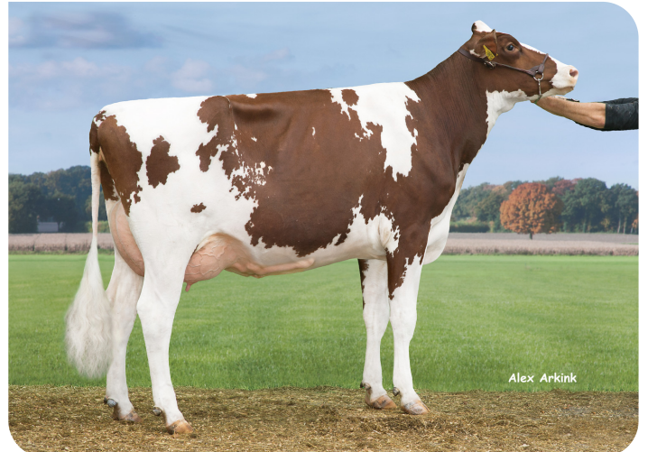
Huntje Anemoon 117 (AB 86) (moeder van Red River)