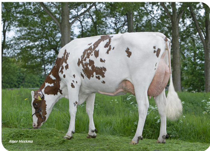
Corrie 90 (v. Red River) (foto als 2de kalfs) Eig.: VOF Verhoef Dairy Farm, Nieuwerbrug aan de Rijn.