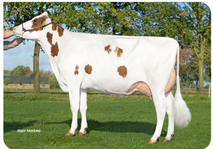
Liza 410 (v. Red River) Eig.: Agri-Services Fokmelkveebedrijf Frencken, Reuver