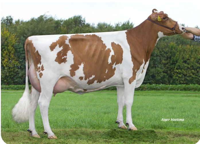
Grashoek Silke 197 (v. Redspot) Eig.: Melkveebedrijf Grashoek b.v., Grashoek