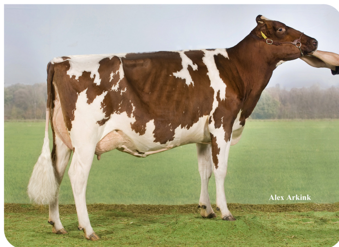
J & G Redspot 36 (AB 87) (moeder van Redspot)