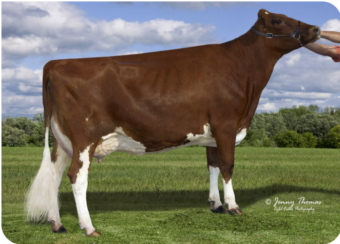
Golden-Oaks Dura Rae-P-Red (VG 88) (moeder van Rex-PP-Red)