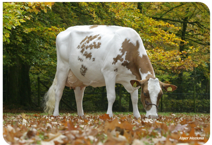
J&G Meisi 5 (AB 89) (moeder van Marsman)