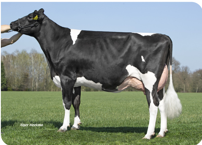
Grashoek Antonia 171 (v. Marsman) Eig.: Melkveebedrijf Grashoek, Grashoek