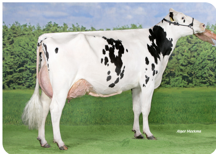
JIMM. Holstein Hellen 589 (A 94) (moeder van Mr. Winner)