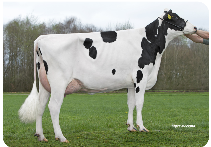
Tailwind Cinderella 4 (v. Mr. Winner) Fig.: Dhr. M. Hekers, Ospel