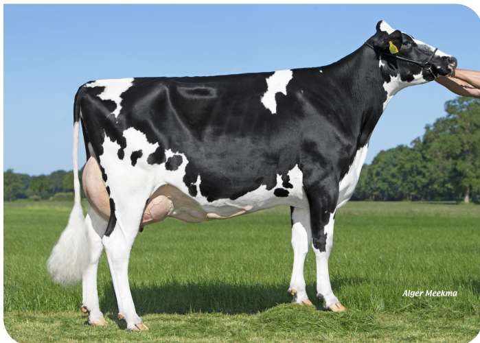
Riempje 387 (v. Booster) Eig. G.H.M Laarhuis, Denekamp