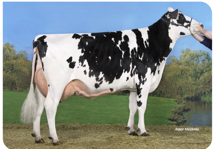
Koepon Jeeves Genua 2 (AB 86) (moeder van Booster)