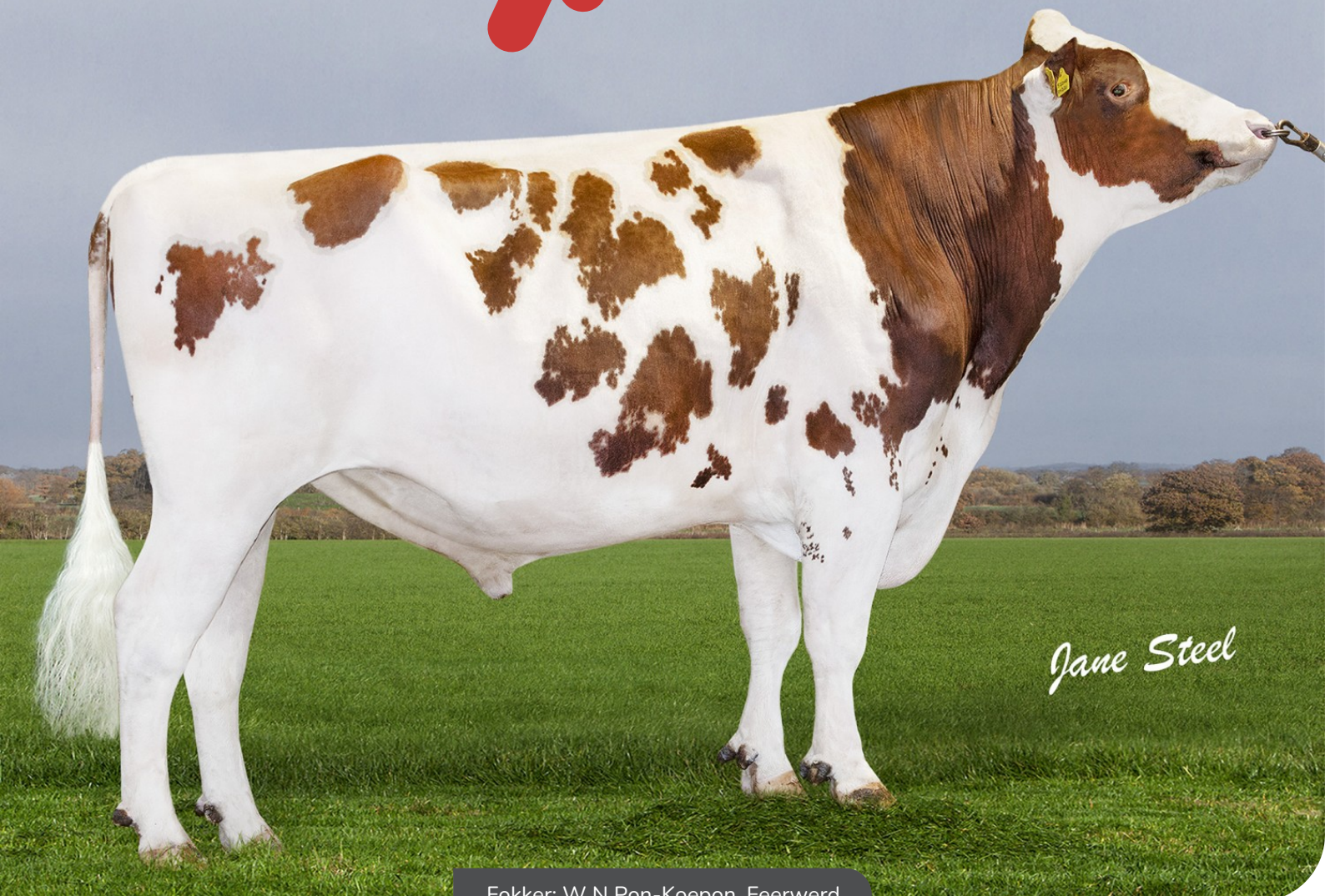
Fokker: W N Pon-Koepon, Feerwerd