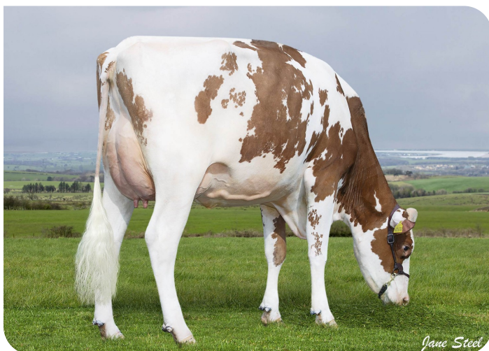
Wyredale Refind Trixie-Red (AB86)(v. Robin Red)