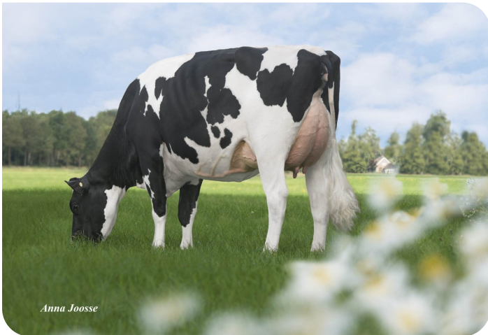
De Oosterhof Dg Rose D Grootmoeder van Robin Red