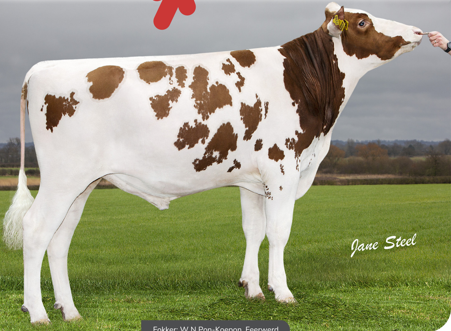
Fokker: W N Pon-Koepon, Feerwerd