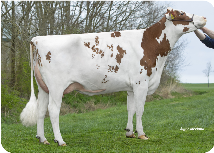
Lakeside Ups Red Range (AB86) Moeder van Robin Red