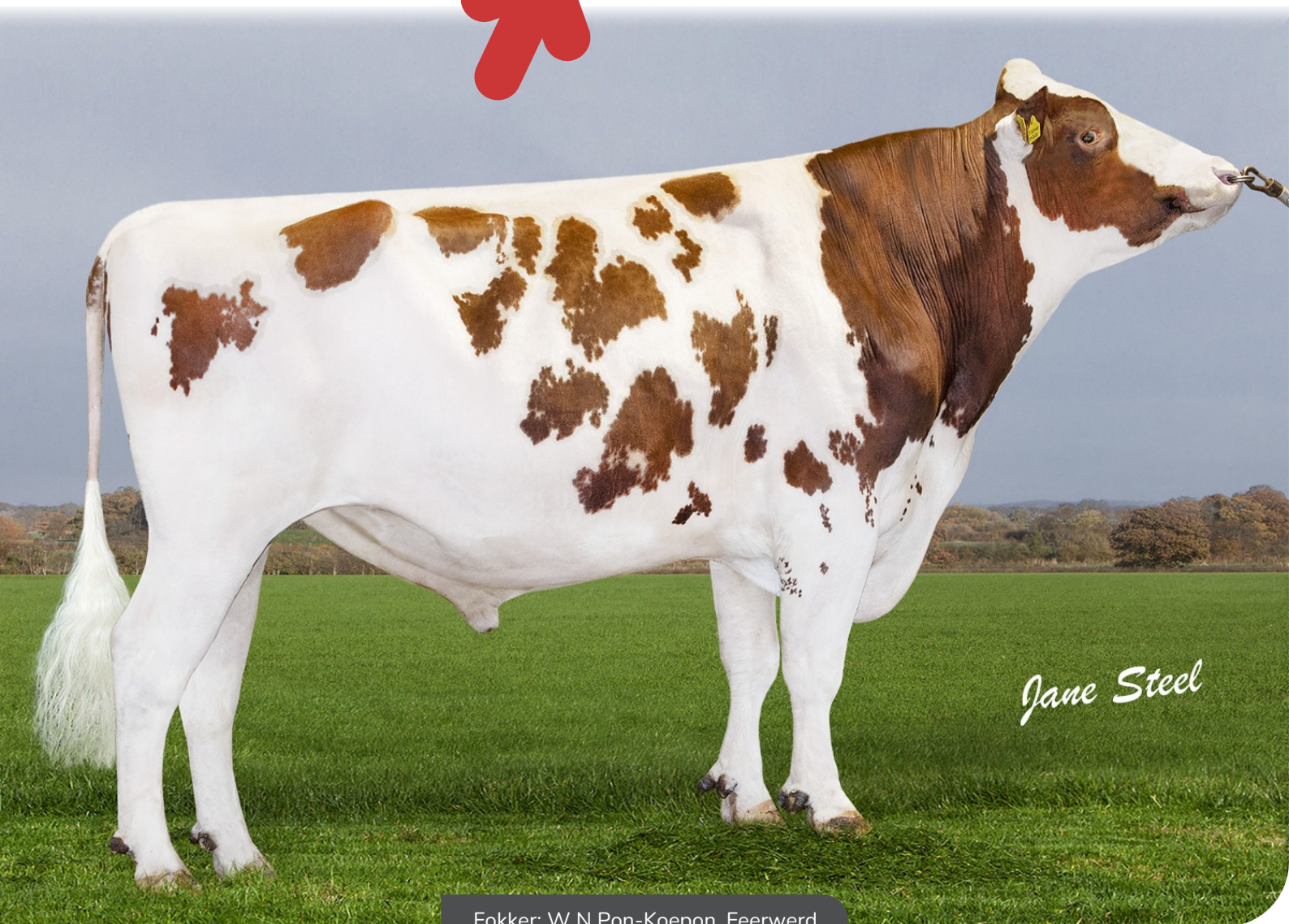
Fokker: W N Pon-Koepon, Feerwerd