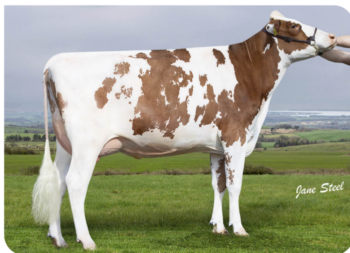
Wyredale Refind Trixie-Red (AB86)(v. Robin Red)