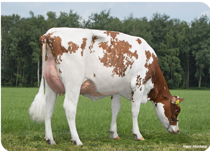
Grashoek Silke 269 (v. Tucson) Eig.: Melkveebedrijf Grashoek b.v., Grashoek