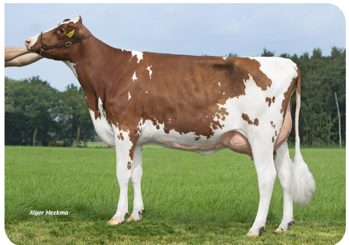
Grashoek Nel 203 (AB 85) (v. Tucson) Eig.: Melkveebedrijf Grashoek b.v., Grashoek